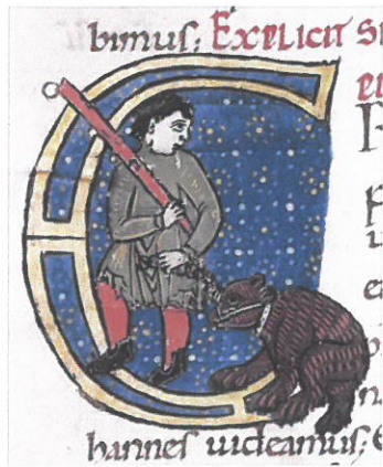
Le Montreur d'ours

évangile de St Jean par St Augustin, XII ème siècle