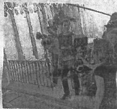
Le tournage s'était déroulé durant l'été 2016.

Ce soir vendredi 17 novembre, à 20 h 55, sur France 2.