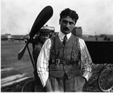
Roland Garros devant un avion Demoiselle B.C. (1910). Bibliothèque nationale de France.