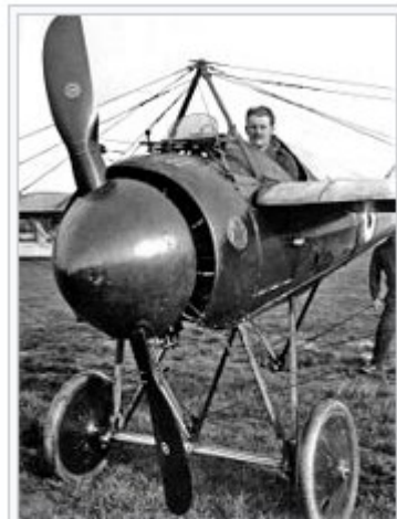
Avion équipé du dispositif de tir à travers le champ de l'hélice, mis au point par Roland Garros.